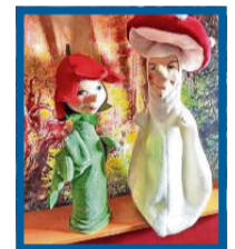
Glöckchen und Pilz

„Nachbarn sind erstmal die, die ganz in meiner Nähe wohnen. Sie sehen zum Beispiel, wer in meiner Räuberhöhle ein- und ausgeht. Man sagt, der liebe Gott sieht alles, aber die Nachbarn sehen noch viel mehr.“