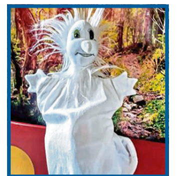
Hui-Buh, das Schlossgespenst

Es ist eine stille und dunkle Nacht. Prinzessin Bella kann nicht schlafen und möchte noch eine warme Milch mit Honig trinken. Vielleicht hat sie auch Glück und trifft noch das furchtlose Schlossgespenst. Kaum hat Bella einen Schluck Milch getrunken, hört sie ein leises Wimmern aus der Vorratskammer. Vorsichtig öffnet sie die Tür. Da sitzt bibbernd vor Angst das furchtlose Schlossgespenst.