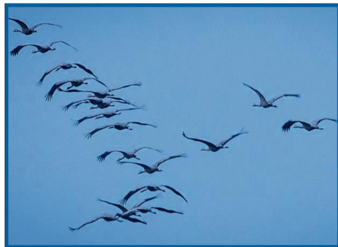
Wenn Kraniche jetzt in den Süden fliegen, formen sie einen Schwarm, der aussieht wie der Buchstabe V.

den erfahrenen Vögeln gehört. Dabei wechselt er sich mit einigen seiner ebenfalls erfahrenen Freunde ab. Hinter ihnen fliegen Familien und junge Vögel, welche sich durch Kalle besser orientieren können. Doch nicht nur auf ihren Reisen ist die Grup-