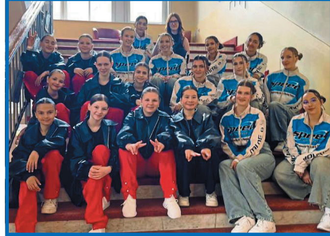
MaCrew und MyDentity vom TSC Castell gehören zur Spitze des westdeutschen Hip-Hop.