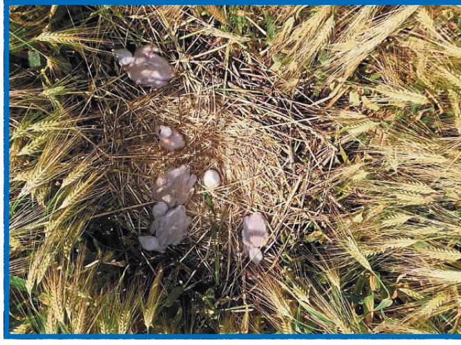
Was wuselt denn da im Nest? Winni und Emma sind stolze Eltern dieses Wiesenweihen-Nachwuchses.

Ich kreise über die Hellwegbörde. Zwischendurch erkunde ich auch andere Gebiete. Aber nirgendwo gefällt es mir so gut wie hier. Es gibt reichlich Mäuse, die ich so gerne fresse. Und nicht nur